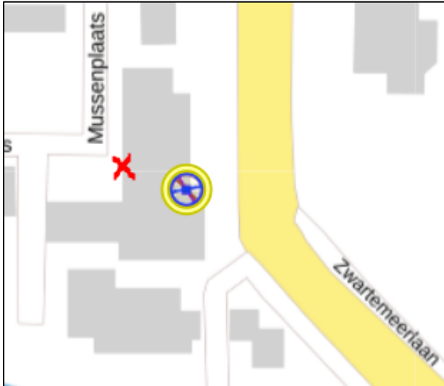
Figuur 2: Weergave van het Antenneregister

Bovenstaande afbeelding (figuur 2) is de weergave van het Antenneregister van de omgeving waar de EMV-meting heeft plaatsgevonden. In de weergave van het Antenneregister zijn een aantal gekleurde cirkels zichtbaar. Deze cirkels geven de opstelplaatsen van de verschillende antenne-installaties weer. Op de locatie met de zwarte, blauwe, bordeaux rode en paarse cirkels is 2G, 3G, 4G en 5G in gebruik. De rode cirkels zijn vaste verbindingen, ook wel point-to-point verbindingen genoemd. De signalen van vaste verbindingen zijn niet meegenomen in de metingen, omdat deze niet voorkomen op meetlocaties op de grond. Daarnaast worden de frequenties die vaste verbindingen gebruiken met andere meetapparatuur gemeten.