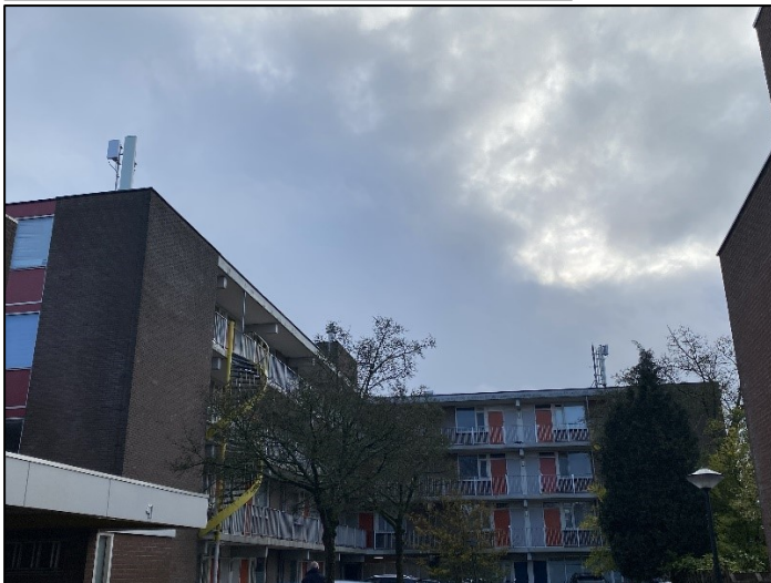
Figuur 1: Foto van de breedbandige indoor meetopstelling en antenne-installaties

Op de foto hierboven (figuur 1) is de breedbandige indoor meetopstelling te zien. Het meetapparaat staat in de woonkamer. De dichtstbijzijnde vast opgestelde antenne-installatie is vanuit de meetlocatie niet te zien (staan boven op het dak van de flat).